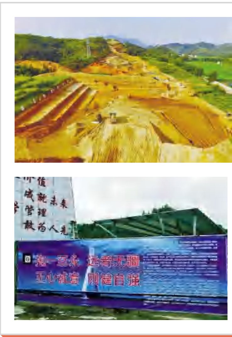
龙建三公司集集至阳江港高速公路集集至郁南段二期工程T8标段项目