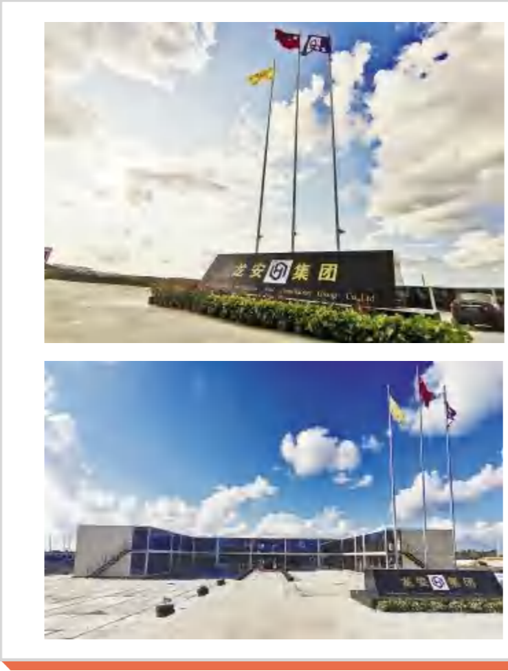
龙安结构公司智能绿色轻量化玻璃瓶生产基地项目